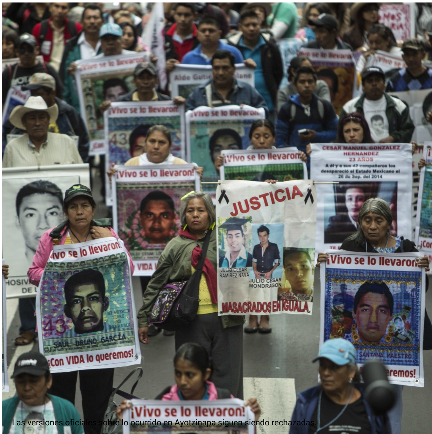
Las versiones oficiales sobre lo ocurrido en Ayotzinapa siguen siendo rechazadas.