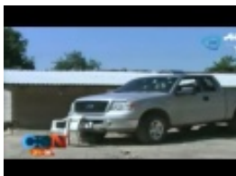
A través de CADENATRES

Accidente afecta la circulación vial en Río Churubusco