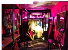
A través de GARUYO