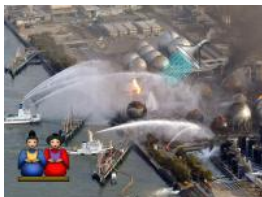
A través de SWAGGER

Fukushima menos agresiva que Chernobyl, pero ¿radiactiva hasta la muerte?