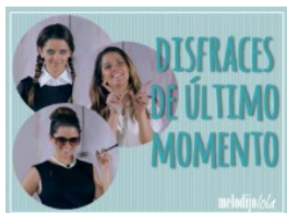
A través de MELODIJOLOLA

Fukushima menos agresiva que Chernobyl, pero ¿radiactiva hasta la muerte?